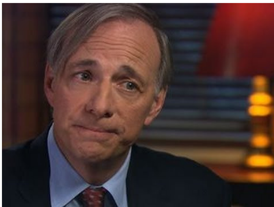
เรย์ ดาลิโอ (Ray Dalio)

รายงานฉบับนี้จัดทำขึ้นโดยข้อมูลเท่าที่ปรากฏและเชื่อว่าน่าเชื่อถือได้แต่ไม่ถือเป็นภาระยืนยันความถูกต้องและความสมบูรณ์ของข้อมูลนี้ เรา โดยบริษัทหลักทรัพย์ ยูโอบี เคย์ ฮีเยน (ประเทศไทย) จำกัด (มหาชน) ผู้จัดทำของสงวนสิทธิ์ในการเปลี่ยนแปลงความเห็นหรือประกาศการณ์ต่างๆ ที่ปรากฏในรายงานฉบับนี้ โดยไม่ต้องแจ้งล่วงหน้า รายงานฉบับนี้มิวัตถุประสงค์เพื่อใช้ประกอบการตัดสินใจของนักลงทุน โดยไม่ได้เป็นการชี้นำชักชวนให้นักลงทุนทำการซื้อหรือขายหลักทรัพย์ หรือตราสารทางการเงินใดๆ ที่ปรากฏในรายงาน